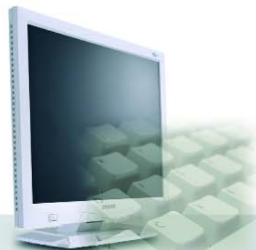
Software Development & Web Solutions